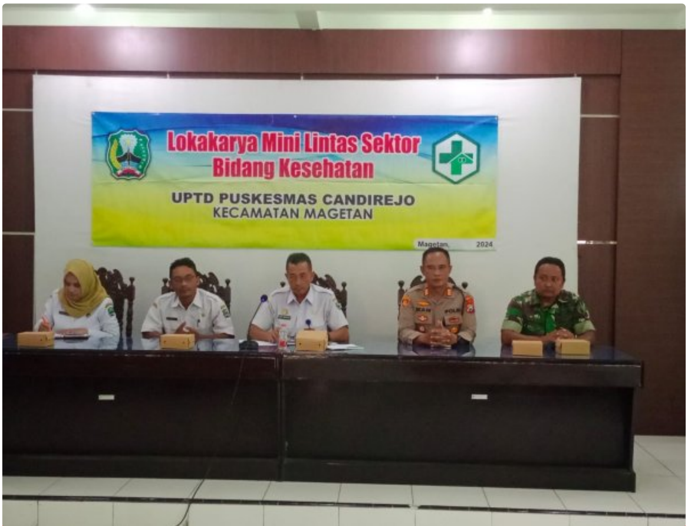
Bati TUUD Koramil 0804/01 Magetan Hadiri Loka Karya Mini Lintas Sektor Tri Bulanan Bidang Kesehatan

MAGETAN. - Bati TUUD Koramil Tipe B 0804/01 Magetan Kodim Magetan Pelda